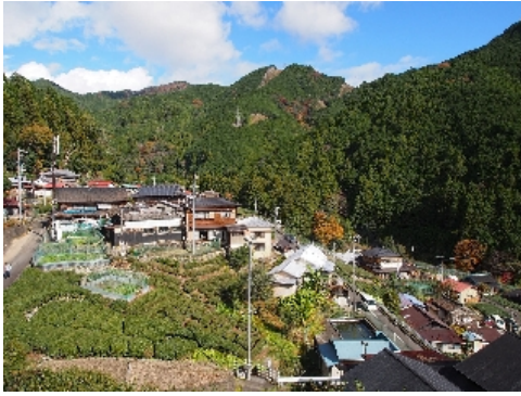
①オクシズ玉川地区大沢