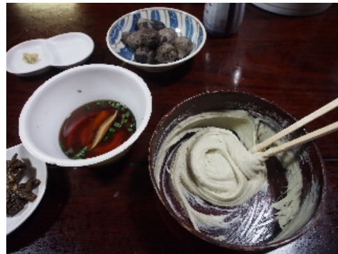
⑯そばがきの出来上がり