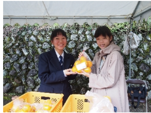
⑧静岡農業高校の生徒さん

公民館横では静岡農業高校の生徒さんたちが自分たちで育てた温州ミカンの販売をしていました。(写真⑦⑧)